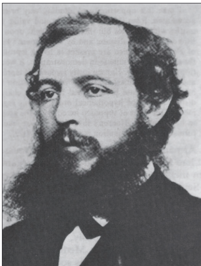
Gerhard Henrik Armauer Hansen (1841-1912)

'Breaking news': in 2016 meldt het tijdschrift 'Science' dat in de natuur voorkomende eekhoorns in Groot-Brittannië besmet zijn met lepra. De millennia oude ziekte stelt ons steeds weer voor verrassingen. In de 19de eeuw werd Europa vanuit de koloniën opnieuw geconfronteerd met deze middeleeuwse gesel, maar lepra was in de 19de eeuw ook in Noorwegen endemisch. De Noor Hansen zei: "er is nauwelijks iets tussen hemel en aarde dat niet is beschouwd als oorzaak van lepra". Met de ontdekking van de leprabacterie (Hansen 1873), was het lepraprobleem helaas nog niet opgelost. De zoektocht naar de complexe ontstaanswijze duurt voort. In deze lezing zal het intrigerende debat over oorzaak en bestrijding en de verrassende rol van Nederland en koloniën worden besproken.